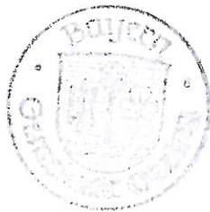
Bauer 2. Bürgermeister